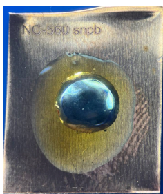
NC-560 SnPb 0 часов

Испытание проводится для оценки коррозии меди под действием остатков флюса. На медной пластине расплавляется капля припоя SnPb и SAC305 в контакте с флюсом. Первоначальные изменения цвета, вызванные нагревом во время пайки, не считаются признаком коррозии. Далее образец выдерживается 10 суток при 40 °C и 85% влажности и осматривается. Флюс Sigma NC-560 прошёл испытание — коррозии, побурения и пятен после выдержки не обнаружено. Результат подтверждает, что флюс не коррозионен и соответствует требованиям IPC J-STD-004B (ROLO) .