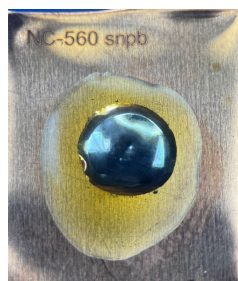
NC-560 SnPb 240 часов